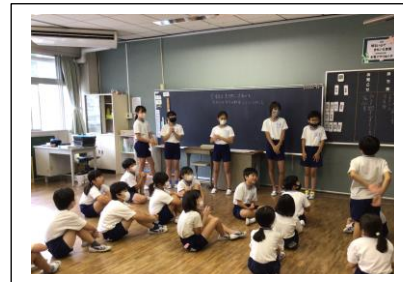
縦割り活動（顔合せ2）