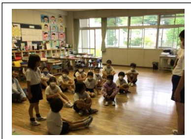
縦割り活動（顔合せ1）